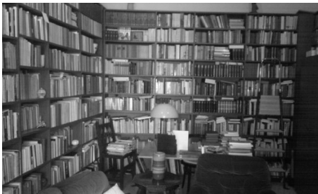
3. Sant Feliu de Guíxols. Estudi abans de buidar les prestatgeries (Montserrat Comas).